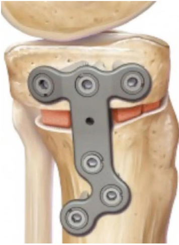
Open wig (vooraanzicht): bot wordt vastgezet met metalen plaat en schroeven.