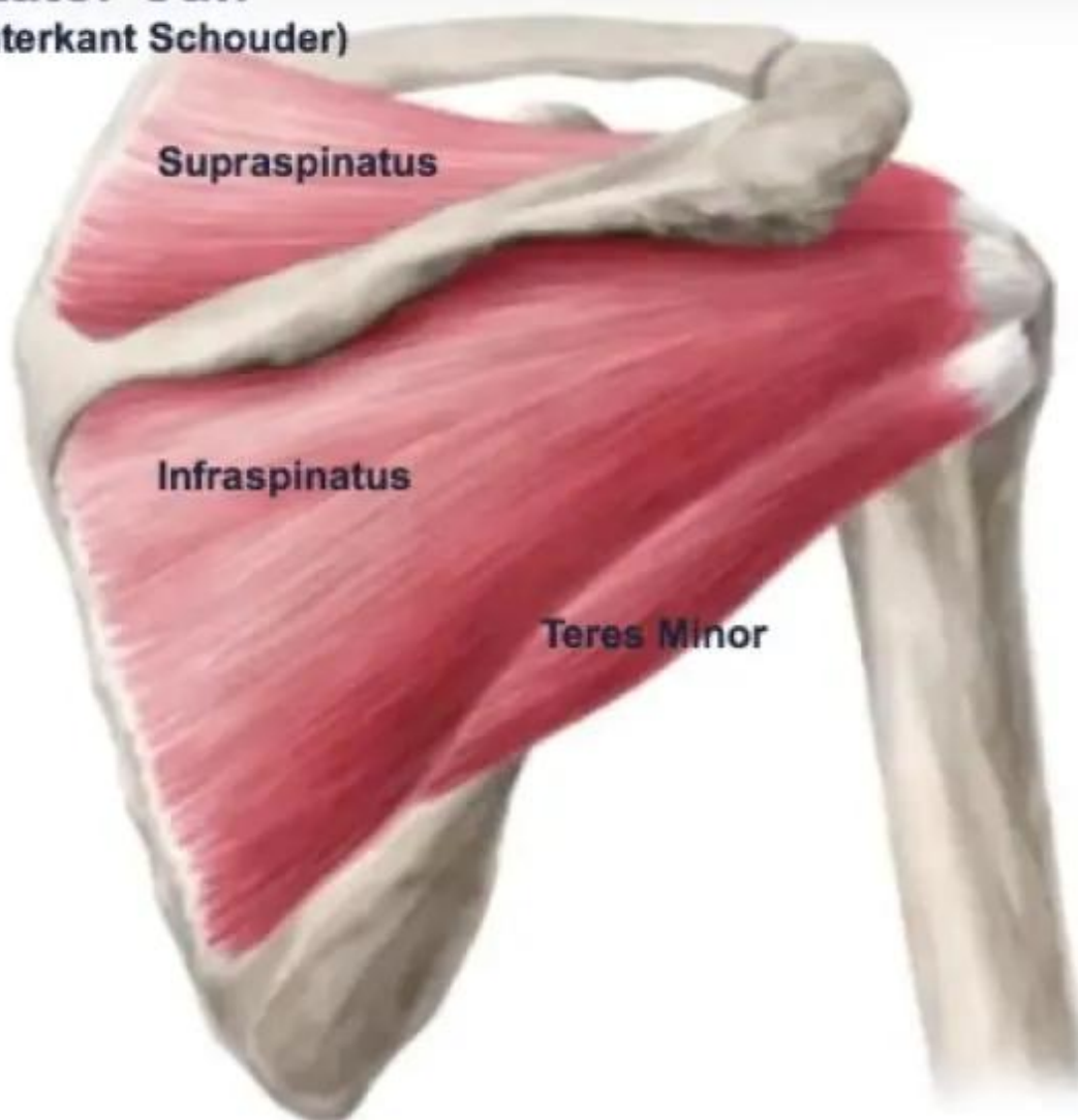
Figuur 2: Rotator Cuff