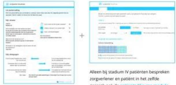
Patiënt en zorgverlener beslissen samen

Zorgverlener en patiënt bespreken de keuzehulp-samenvatting . Samen kiezen