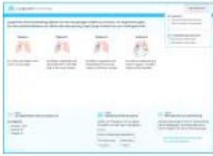
Zorgverlener reikt de keuzehulp uit

Met het keuzehulp-uitreiksel legt de zorgverlener de diagnose en behandelopties uit. Op het uitreiksel staat een link naar de keuzehulp en een unieke infocode.