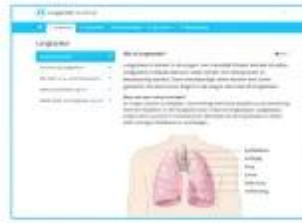
Patiënt gebruikt de keuzehulp

De patiënt leest thuis informatie in de online keuzehulp . En vul afwegingen en voorkeur in.