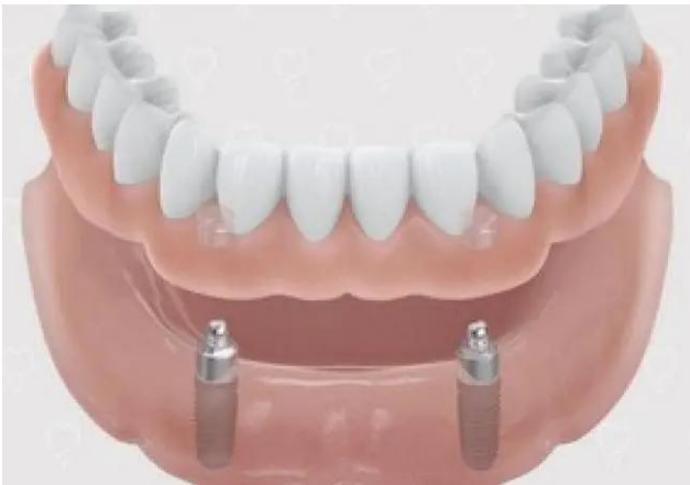
Uitneembare prothese bevestigd op drukknopen