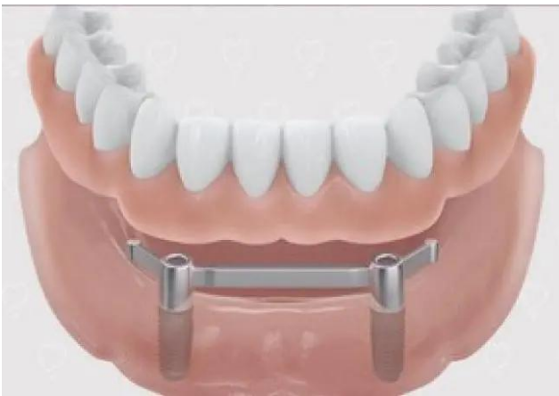
Uitneembare prothese bevestigd met een steg - onderkaak