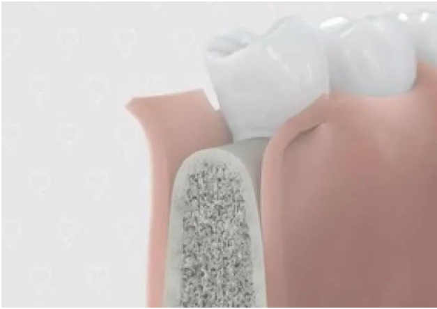
1. Kaakbot wordt blootgelegd