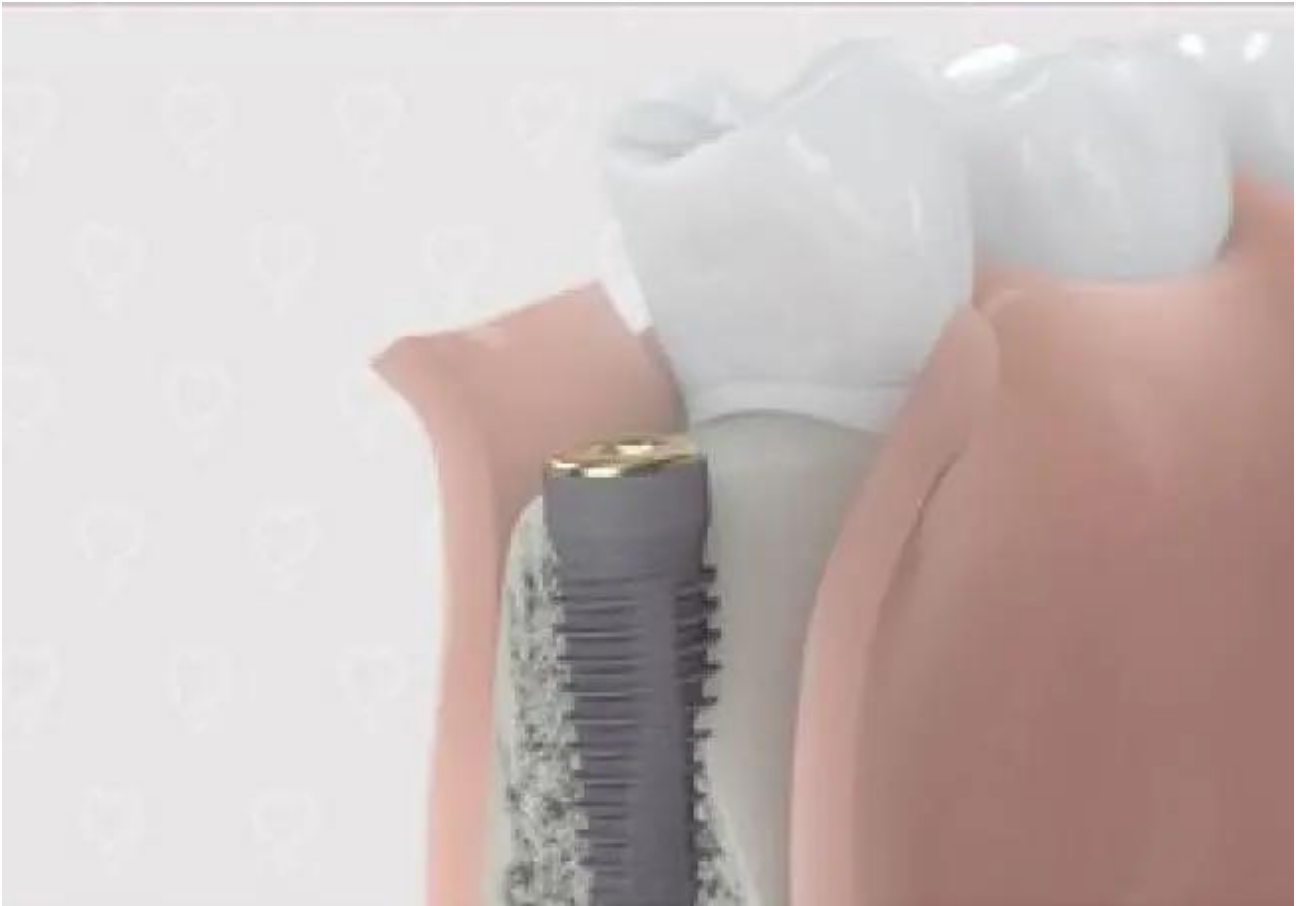
1. Te weinig bot in de onderkaak