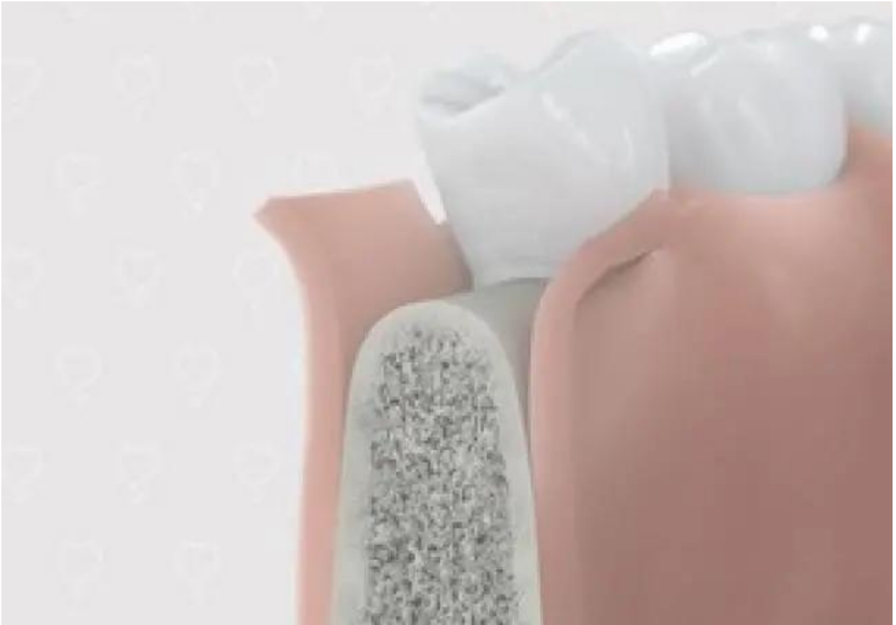
1. Kaakbot wordt blootgelegd