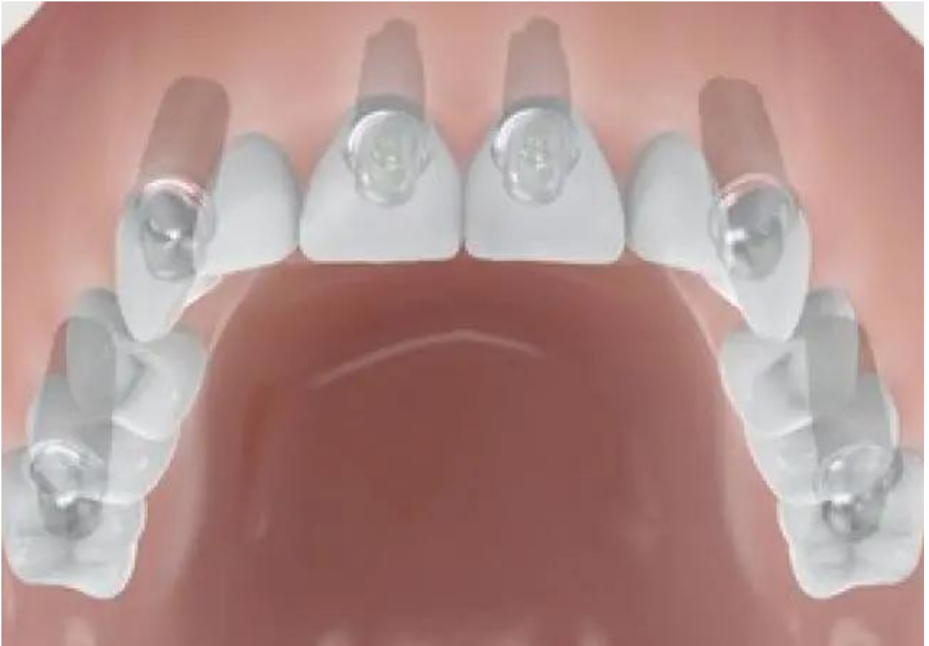
Volledig gebit boven- of onderkaak vervangen - uitneembare prothese