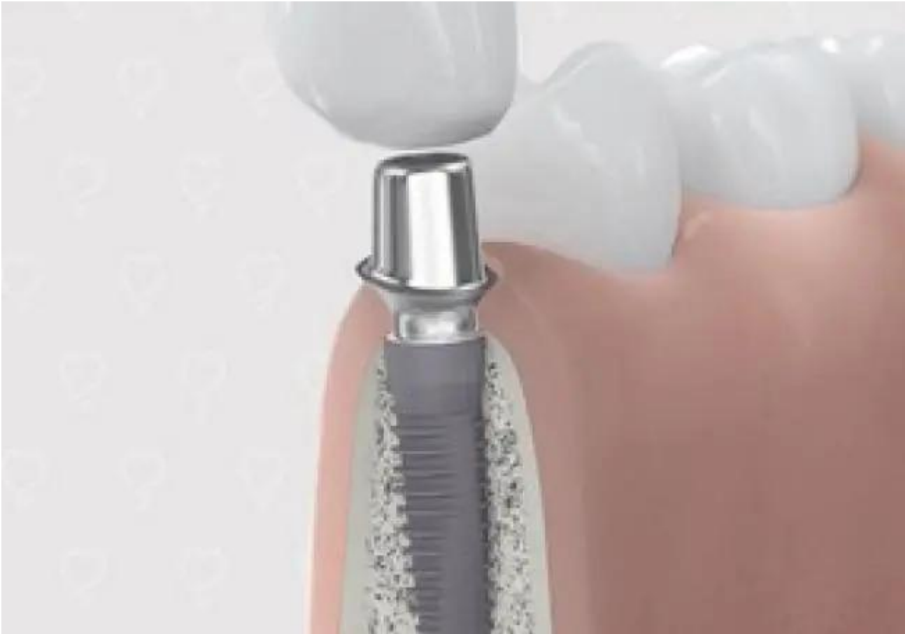
4. Plaatsen van abutment en kroon