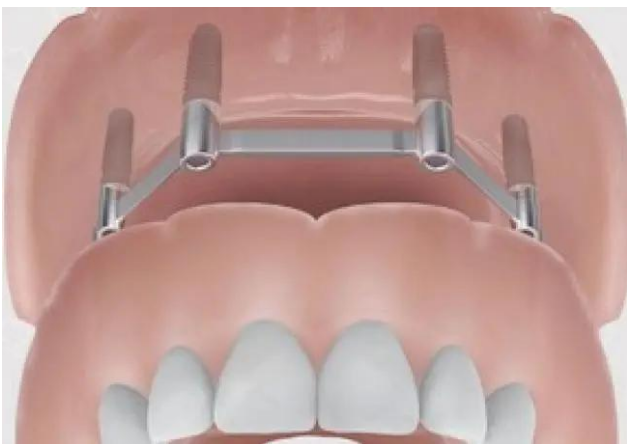
Uitneembare prothese bevestigd met een steg - bovenkaak