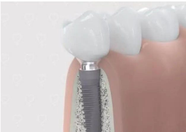
5. Eindresultaat behandeling