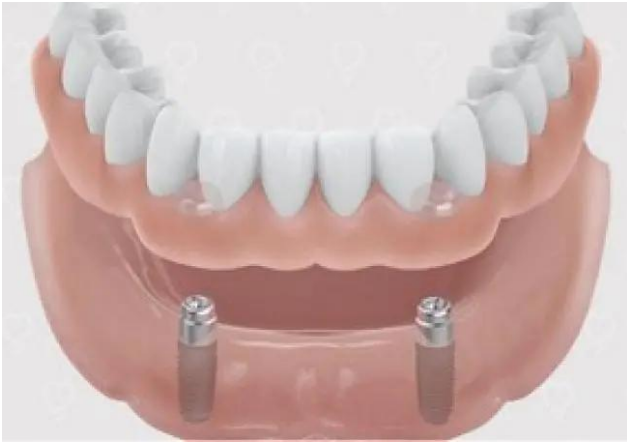
Uitneembare prothese bevestigd locators (rechts)