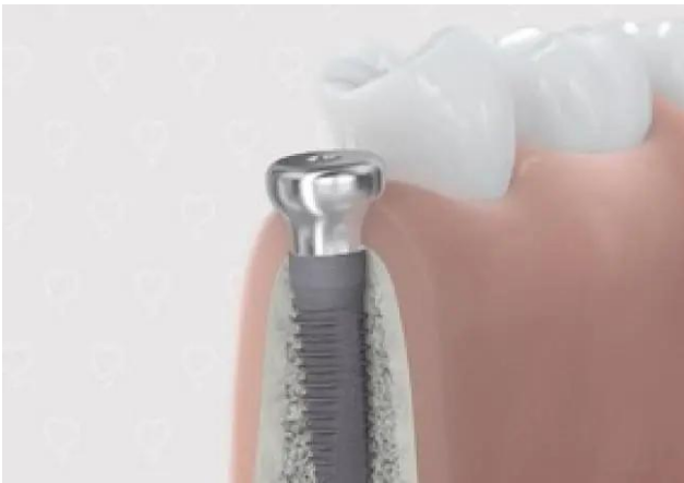
3. implantaat wordt geplaatst