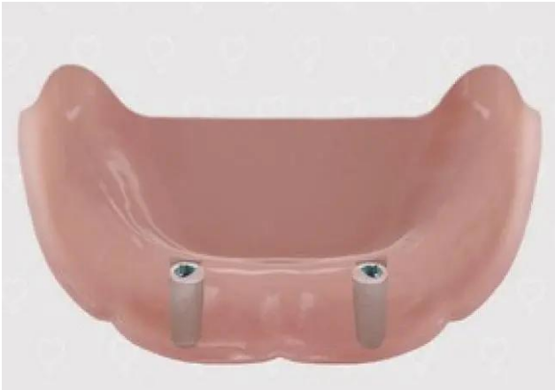
Implantaten in de onderkaak