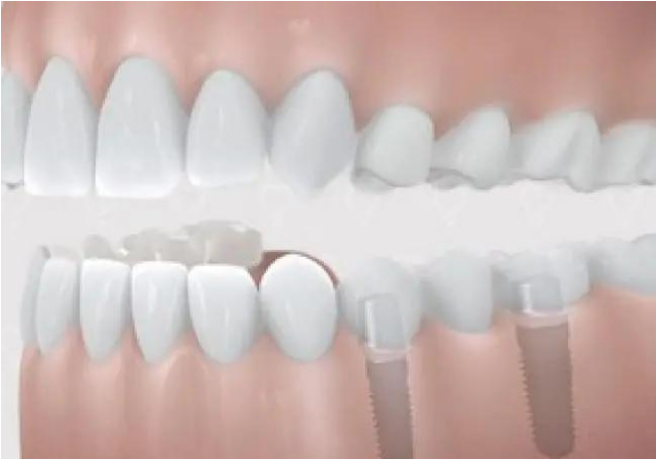
Volledig gebit boven- of onderkaak vervangen - vaste prothese