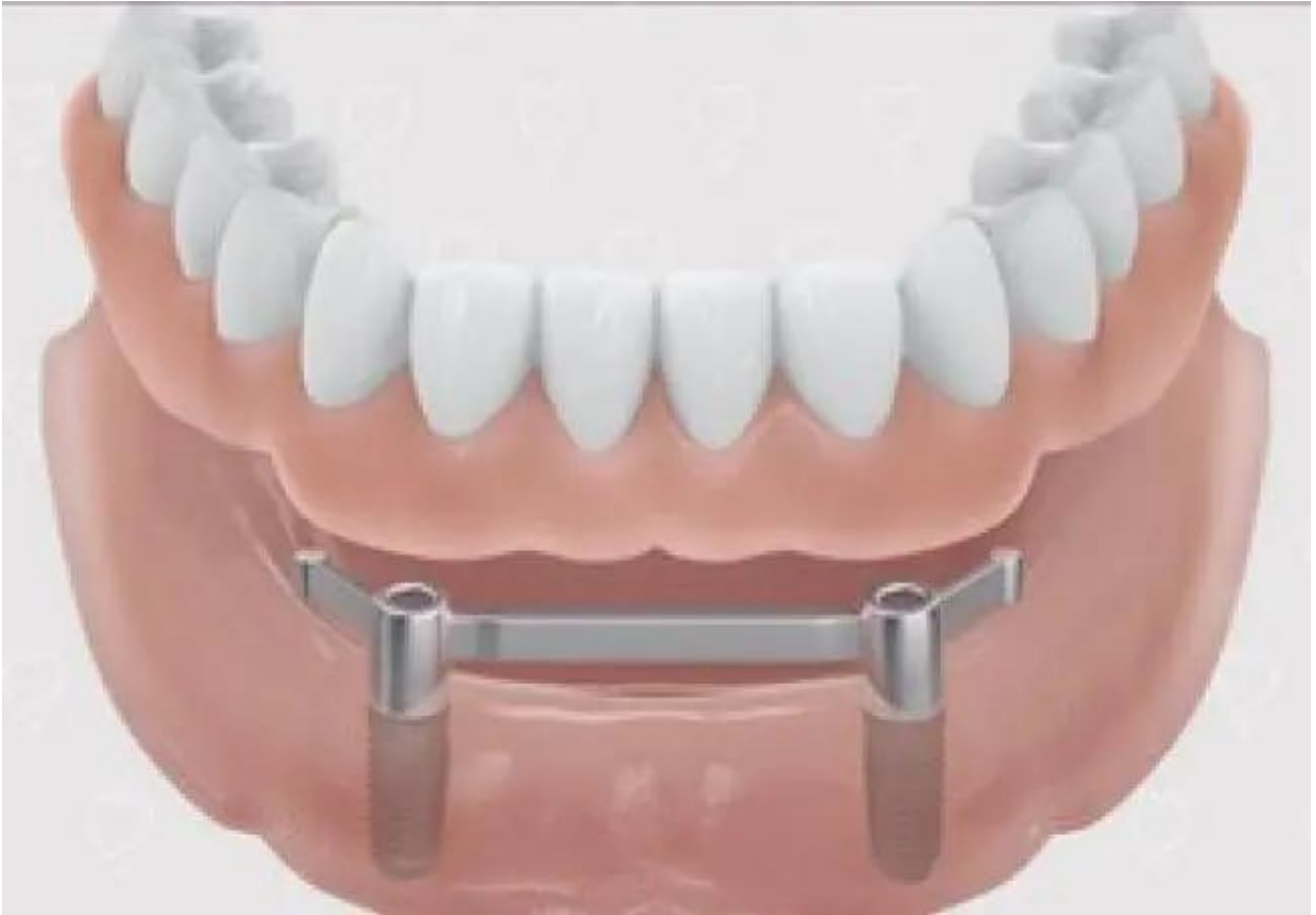
Uitneembare prothese bevestigd met een steg - onderkaak