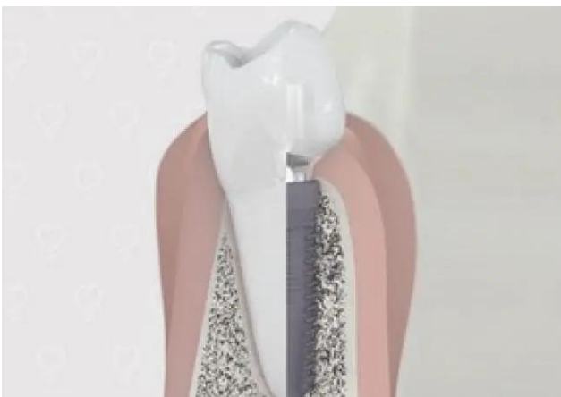
6. Natuurlijke wortel / tandwortelimplantaat

Hoe lang het plaatsen van de implantaten duurt, is afhankelijk van hoeveel implantaten er bij u worden geplaatst en van uw persoonlijke situatie.