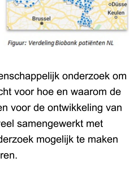
Figuur: Verdeling Biobank patiënten NL

Voor betrouwbaar wetenschappelijk onderzoek zijn grote groepen patiënten nodig. Om deze keer op keer bijeen te brengen bij de zeldzame ziekten ILD was een grote uitdaging. Om meer onderzoek mogelijk te maken is het St. Antonius ILD Expertisecentrum in 2005 met de Biobank ILD studie gestart. Een unieke verzameling van medische gegevens en lichaamsmaterialen over de hele ziekteduur van ILD patiënten.