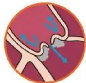
Aortaklep met bacteriële endocarditis