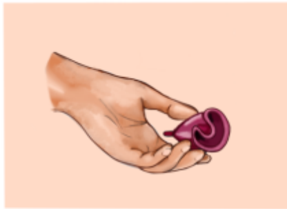
inbrengen van de menstruatiecup