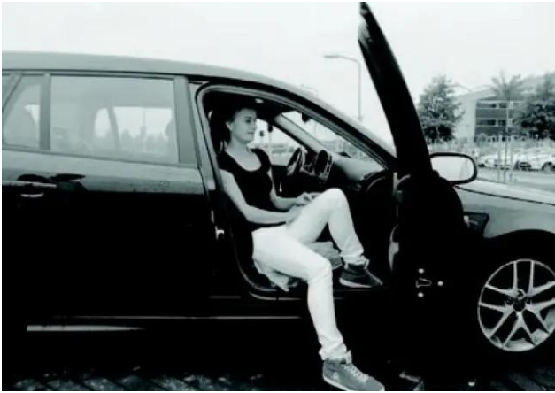
5D. U 'ligt' in de auto