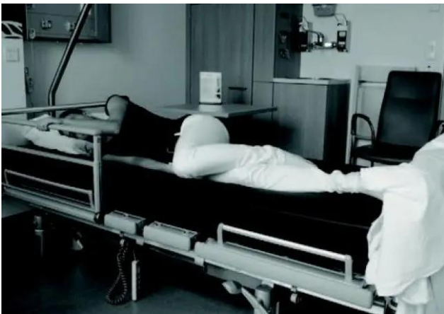
1C. Uw romp komt omhoog, uw benen gaan omlaag.