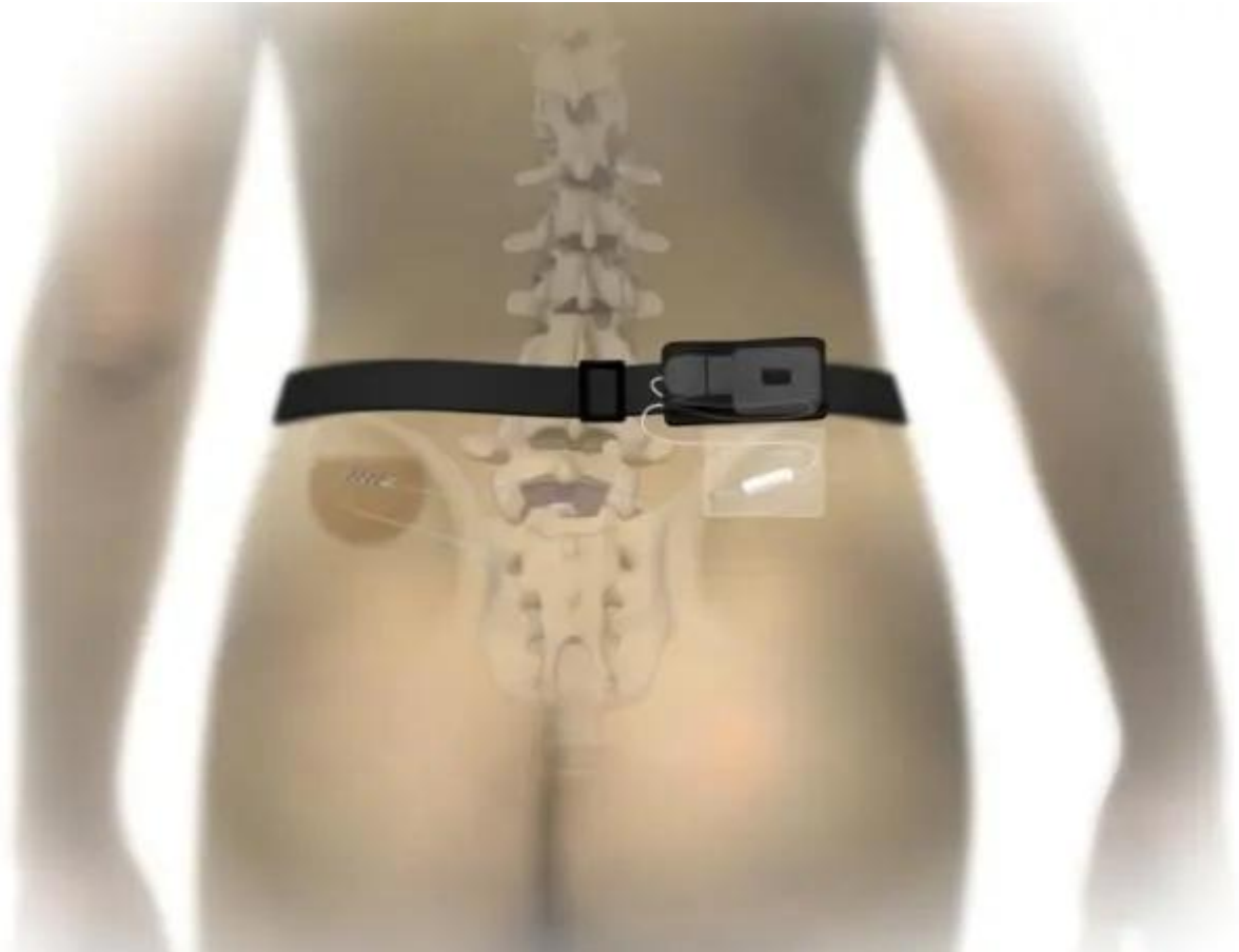
Uitwendige neuromodulator

Het aansluiten en activeren van de neuromodulator gebeurt 's middags op de afdeling of de volgende ochtend op de polikliniek door de arts of physician assistant. Het verlengkabeltje wordt aangesloten op de uitwendige neuromodulator, die u in een gordel onder de kleding draagt. De neuromodulator geeft stroompjes af en stimuleert de zenuw. De afstandsbediening voor de uitwendige neuromodulator werkt draadloos, hiermee kunt u zelf de sterkte van de prikkeling aanpassen. Naast de uitleg krijgt u tevens de nodige informatie en instructies mee.