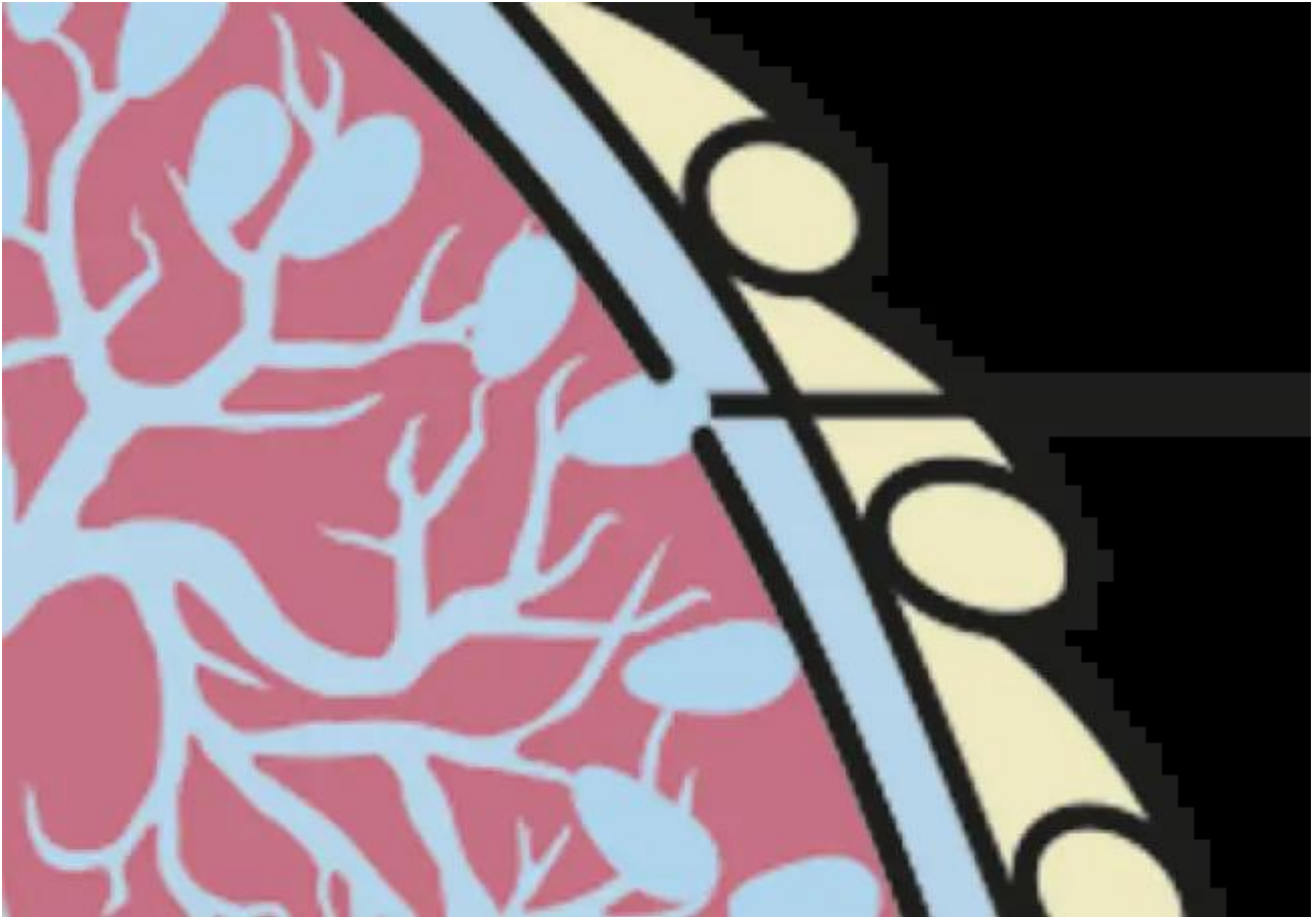
Afbeelding: scheurtje in het longvlies