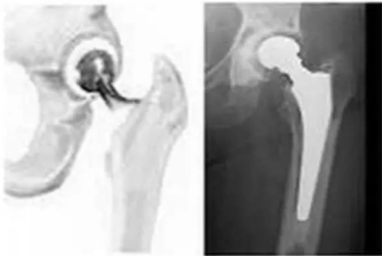
Figuur 1: heupprothese

Bij een totale heupvervanging worden beide gewrichtsuitenden van de heup (de kop en de kom) verwijderd en vervangen door een kunstheup; de prothese.